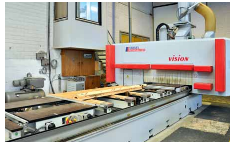
CNC-Bearbeitungszentrum „Vision-II-ST Sprint“ mit aufgespanntem Standardkrümmung

www.gussek-treppenbau.de www.reichenbacher.de